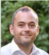
Bürgermeister Mauro Dalla Barba