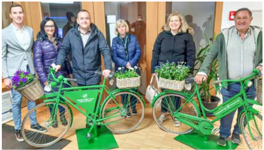
Das Fahrrad wird in der Marktgemeinde Latsch zukünftig eine große Rolle spielen.