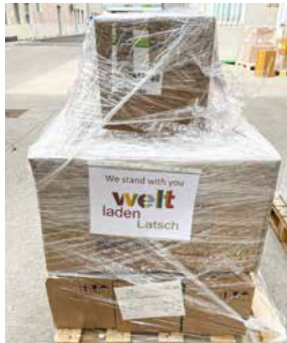
Die Medikamente sind sicher in Kiew angekommen.