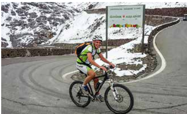
Der ehemalige Gesundheitslandesrat Richard Theiner ging in Sachen Sport und Bewegung immer mit gutem Beispiel voran.