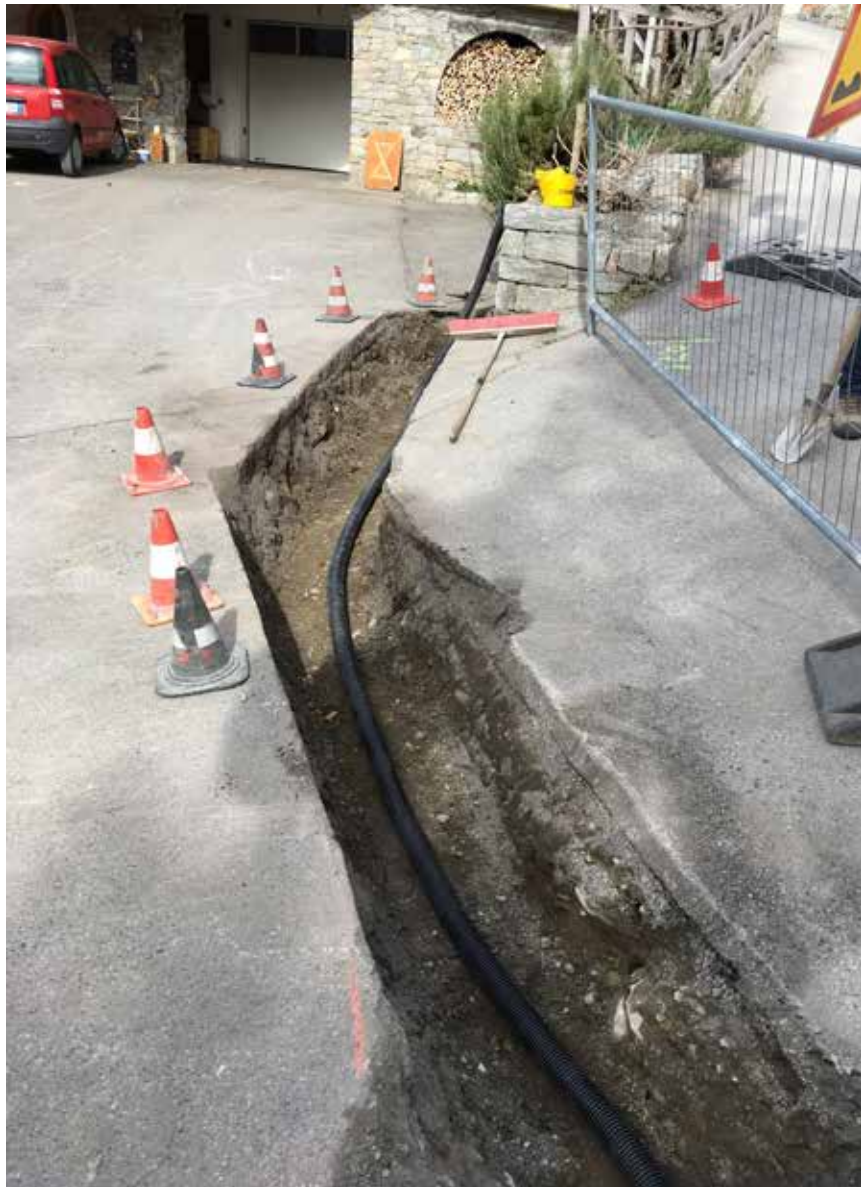
Die Arbeiten laufen auf Hochtouren.

In Tis, wo es kein Fernheiznetz gibt, sind die Grabarbeiten ebenfalls abgeschlossen. In Tis haben sich 95 Prozent der Familien für einen Anschluss entschieden. In Goldrain selbst wurde die Glasfaser im EGL Netz verlegt und die Grabarbeiten ebenfalls in Angriff genommen. Auch in Morter ist ein Großteil des EGL Netzes schon verlegt, kleinere Grabarbeiten für das Hauptnetz wer-