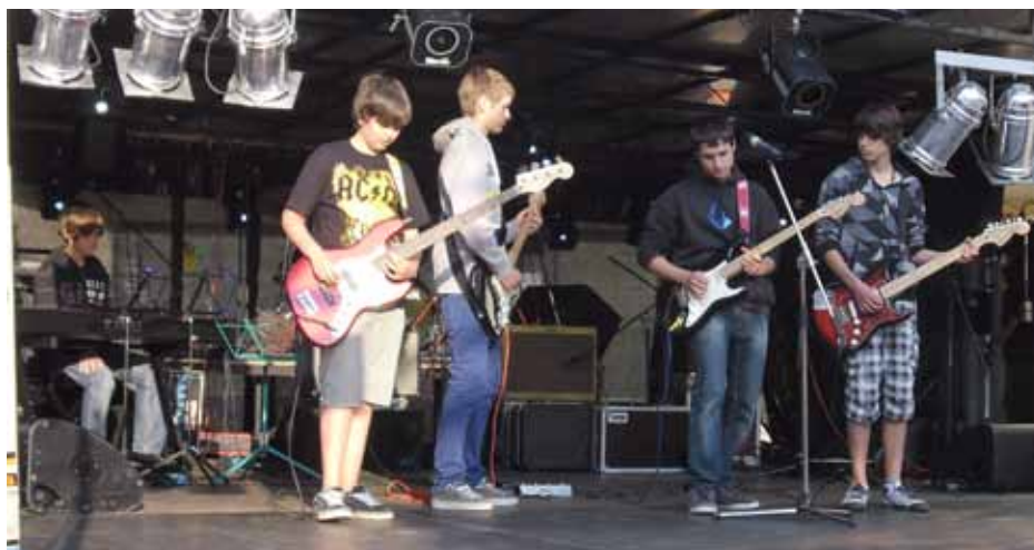
Die Band „The New Kids“ coverte unter anderem den AC/DC-Klassiker TNT

Unter dem Motto „Mitten in Latsch“ rockten im Rahmen der Latscher Kulturtag verschiedene Nachwuchsbands der Musikschule Meran, am Freitag, 18. Mai, den Lacusplatz. Schüler der Musikschule Meran inszenierten dabei gemeinsam mit