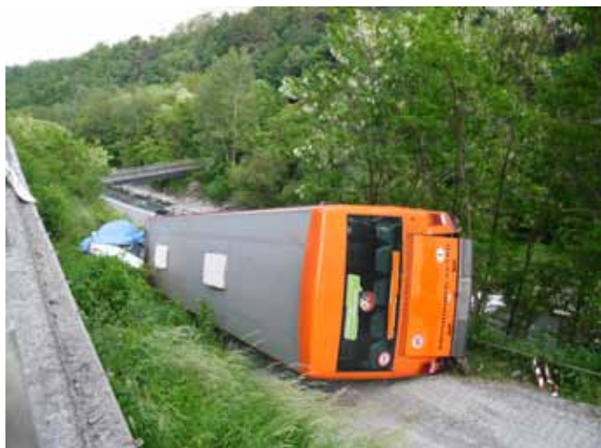
Autofahrer staunten nicht schlecht, als sie am „verunglückten“ SAD-Bus bei der Latschander vorbeifuhren.