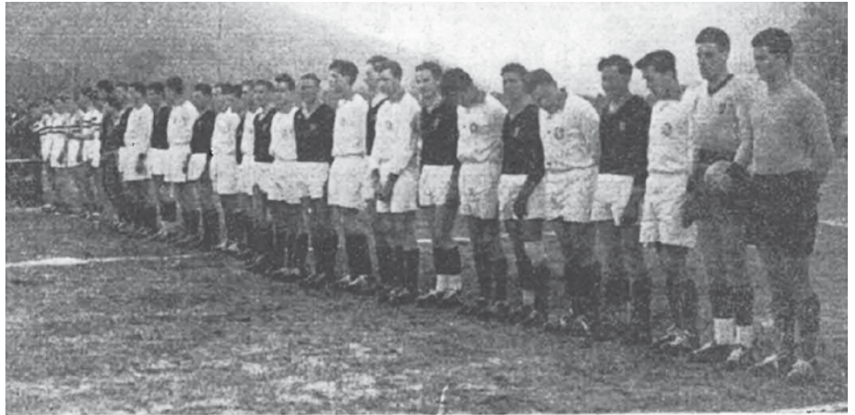
Vor der Eröffnung des neuen Latscher Sportplatzes nahmen die Mannschaften Aufstellung. In Reih' und Glied stehen die Fußballer da.