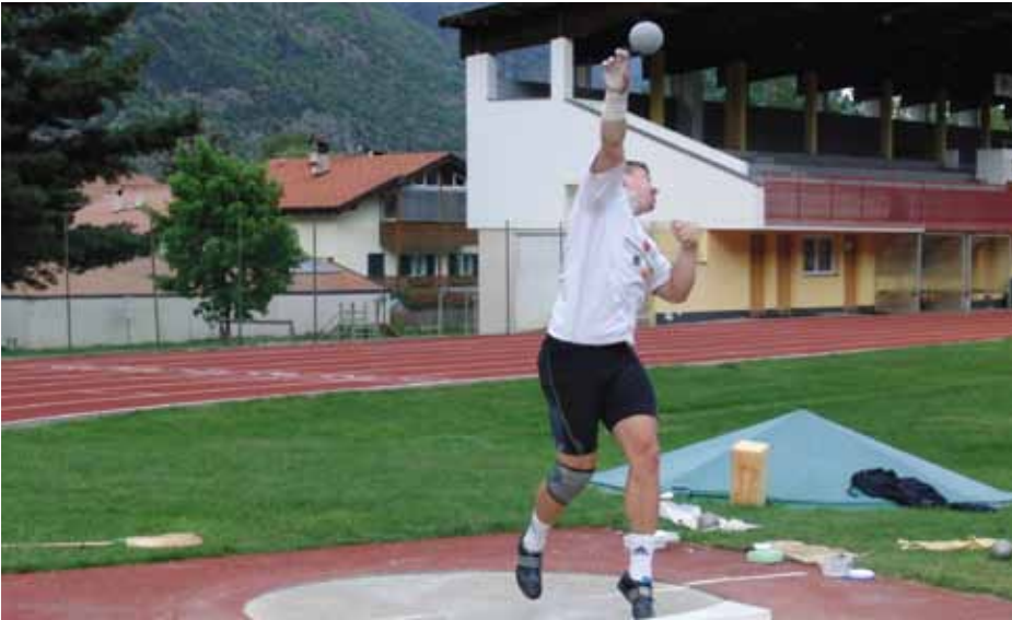
Der aktuelle Kugelstoß-Weltmeister David Storl aus Deutschland ist zählt bereits zu den Latscher Stammgästen auf der beliebten Leichtathletikanlage, was die Vorbereitung auf Großereignisse betrifft.

von 09.00 bis 12.00 Uhr wird dabei garantiert. Im Preis von 40 Euro sind eine Trainingsausrüstung mit Hose und Leibchen, kostenlose Getränke während der Trainingseinheiten, eine Pause mit Verpflegung und Getränke und verschiedene Preise inbegriffen. Die Teilnahmegebühr ist bis spätestens acht Wochen vor Beginn dieses dreitägigen Camps auf das Konto der Viva:Latsch (IBAN:IT32F0811058450000300008991) zu überweisen. Zum Abschluss erhält ein jeder Teilnehmer eine Urkunde mit Erinnerungsfotos, ein Abschlussgrillen steht ebenfalls auf dem Programm.