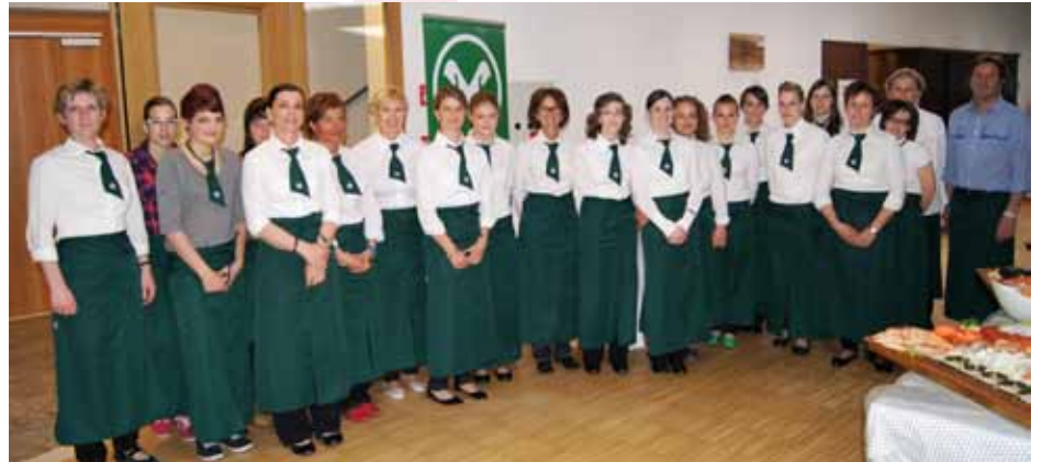
Der Damenfußballclub Red Lions Tarsch, die Bäuerinnen und Senioren von Latsch, der Latscher Sportverein und die Mitarbeiterinnen der Raiffeisenkasse bemühten sich gemeinsam um das leibliche Wohl der Mitglieder.

Trotz Banken-, Staaten-, Liquiditätskrise und dem damit zusammenhängenden Wirtschaftsabschwung blickte die Raiffeisenkasse Latsch bei ihrer diesjährigen Vollversammlung auf ein erfolgreiches Geschäftsjahr 2011 zurück. Den zahlreich erschienenen Mitgliedern wurde eine positive Bilanz präsentiert. Das Kundengeschäftsvolumen, bestehend aus den Hauptgeschäftsfeldern Einlagen und Kredite, hat sich gut entwickelt. Die verwalteten Mittel stiegen um 1,14% auf über 167 Mio. Euro. Die im Einzugsgebiet vergebenen Kredite nahmen um 6,36% zu und überschritten die 122 Mio. Euro Grenze, was ein gesundes Investitionsverhältnis zwischen Ein- und Ausleihungen darstellt. Die notleidenden Kredite lagen im Bilanzjahr 2011 mit 0,018% weit unter dem Landesdurchschnitt. Durch die ausgeglichene und nachhaltige Geschäftspolitik konnte die Eigenkapitalausstattung auf über 33 Mio. Euro aufgestockt werden und dies schafft Sicherheit. Gerade in schwierigen Zeiten ist es wichtig einen verlässlichen Partner zur Seite zu haben dem man vertrauen kann, so der Obmann in seinen Worten. Hinter den positiven Bilanzzahlen steht auch der Mehrwert, der sich aus den vielen Aktivitäten des Jahres ergibt. Der Begriff Sozialbilanz des Unternehmens fasst die Dinge zusammen, welche für die Gemeinschaft