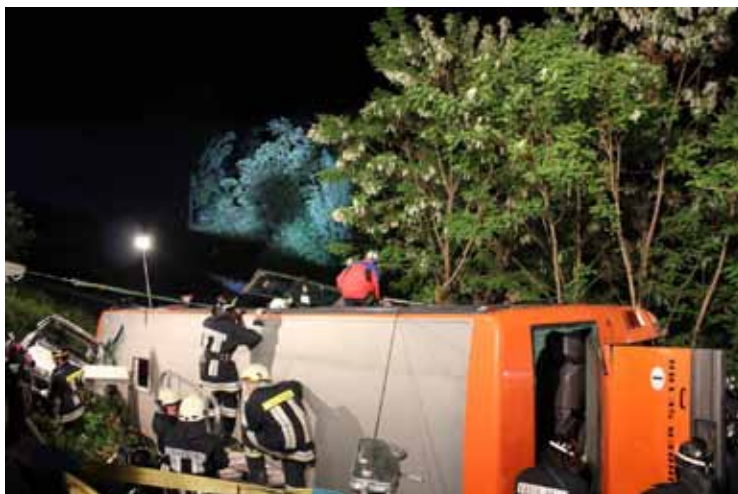
Die Großübung fand nachts, ab 21.45 Uhr, statt.

Erstaunt blickten Autofahrer am Nachmittag des 18. Mai, auf der Strecke zwischen dem „Holzhittl“ und Kastelbell, auf die Zufahrtsstraße zum Radweg bei der Latschander: Ein SAD-Bus lag unterhalb der Staatsstraße, daneben das in den Unfall verwickelte Personenfahrzeug. Manch einer glaubte, einen schlimmen Verkehrsunfall entdeckt zu haben. Es handelte sich