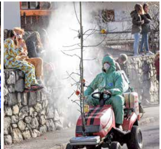
Auch ein Malser Biobauer war mitsamt seiner Ernte nach Latsch gekommen