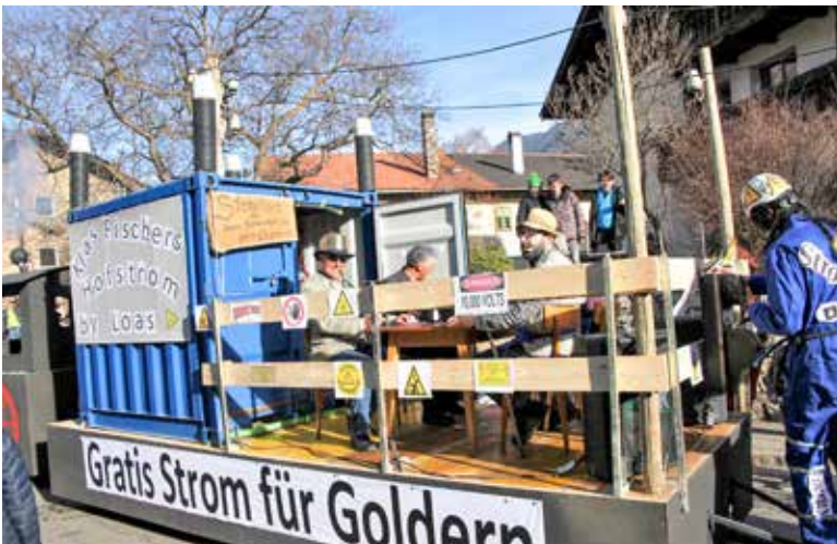
Der nächste Stromskandal beginnt in Goldrain

InfoForum: Danke für das Gespräch, Gratulation zur gelungenen Veranstaltung und hoffentlich bis zum Umzug in zwei Jahren.