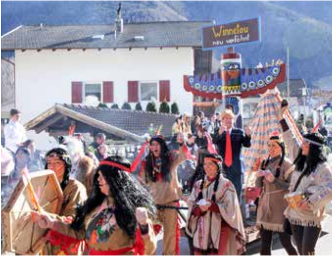
Donald Trump als Winnetou