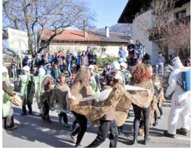
Die Latscher Prozessionsspinner

zuges bei der Halle der Freiwilligen Feuerwehr bis zur Poststation in der Bahnhofstraße war links und rechts der Straße fast alles voll.