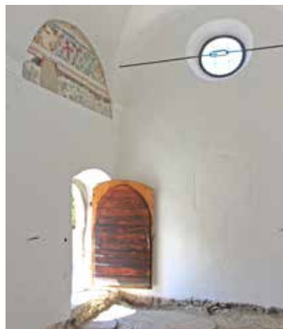
Die neu sanierte Nikolauskirche von Innen.

„Die Magie des Menhirs“. Inhalte der Ausstellungen sind: andere Menhire im Vinschgau, in Südtirol, im Alpenraum - Die Symbolik des Latscher Menhirs - Objekte aus der Zeit des Menhirs - Wie sah Latsch in der Kupferzeit aus? Jetzt wird auf den bestehenden Lehmbo den ein aufgeständerter Boden aus