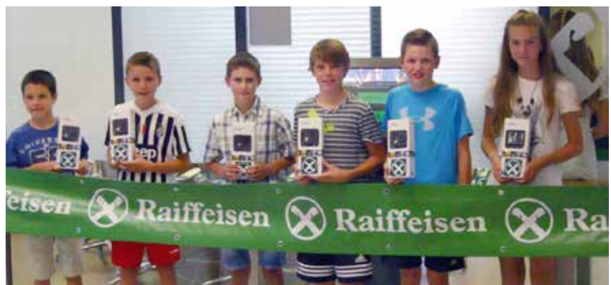
Strahlende Gesichter bei den Hauptgewinnern

All jene, welche 8 und mehr Punkte schafften, nahmen zudem an der Verlosung der Hauptpreise, sieben Actionkameras GoPro Hero, teil. Unter Aufsicht eines Funktionärs der Handelskammer Bozen wurden Anfang August die glücklichen Sieger ermittelt. Bei einer kleinen Feier in der Raiffei-