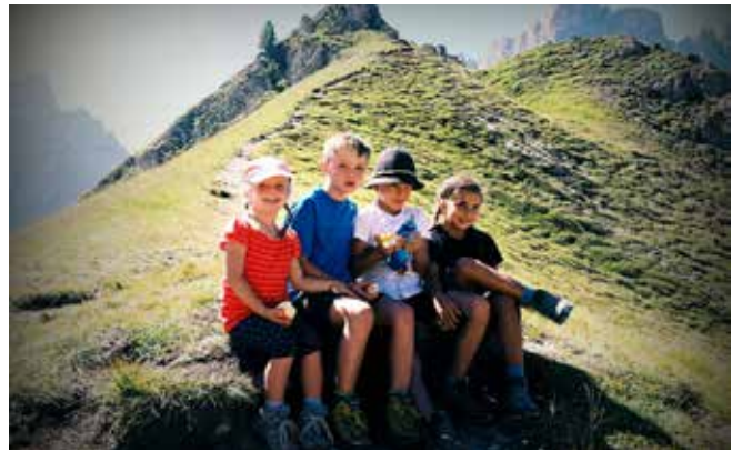
Auf dem Kreuzjoch

Fünf Familien mit 10 Mädchen und zwei Buben im Alter von drei bis dreizehn Jahren verbrachten Ende August wunderschöne Tage im Selbstversorgerhaus „Zanser Alm“ im Villnösstal. Am Donnerstagnachmittag sind wir angereist. Mit einem Grillabend im Freien und einem wunderschönen Ausblick auf die Geislerspitzen wurde der Tag beendet. Den Freitag verbrachten wir im Klettergarten; die ganz Mutigen unter uns konnten sich über einen Abhang abseilen.