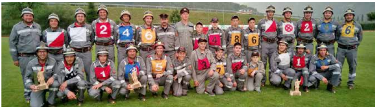
Beide Bewerbungsgruppen der FF Latsch und Jugendgruppe Gemeinde Latsch/Martell

Die Freiwillige Feuerwehr von Latsch bedankt sich bei der Dorfbevölkerung für den Besuch beim Feuerwehrfest, für die Spenden für den Glückstopf und bei allen freiwilligen Helfern.