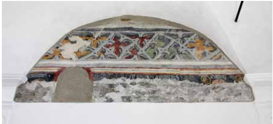
Die freigelegten Fresken über der Tür im Innenraum.

Die Nikolauskirche in Latsch wurde im Auftrag des Heimatpflegevereins Latsch bereits vor einiger Zeit außen grundlegend saniert. Jetzt ist die Innensanierung ebenfalls abgeschlossen. Dabei wurde der barocke Putz erhalten. Im Sockelbereich wurde der salzbelastete Putz ausgetauscht. Über der Tür im Innenraum wurden ca. 3,5 m 2 Fresken freigelegt. Ebenfalls wurde ein Apostelzeichen an der Nordseite freigelegt. (siehe Fotos) Abschließend wurde der gesamte Innenraum mit Kalkfarbe weiß ausgemalt. Da der Lehmbo den in der Kirche erhalten werden soll, wurde dieser gesäubert und der Algenbefall behandelt. Primäres Ziel ist es die Nikolauskirche als historischen Bau zu erhalten. Der Heimatpflegeverein Latsch möchte die Kirche weiter aufwerten und plant den Latscher Menhir dort einen passenden Ausstellungsraum zu geben. Die Planungsarbeiten sind im vollen Gange. Schwerpunkt des Ausstellung-Konzeptes ist