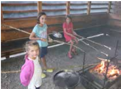
Hier werden Marshmallows gebraten