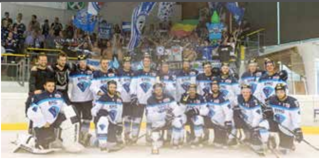
Super Stimmung im IceForum Latsch – im Bild das Siegerteam aus Deutschland