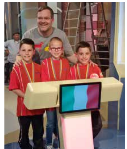
Die Kandidaten mit Elton