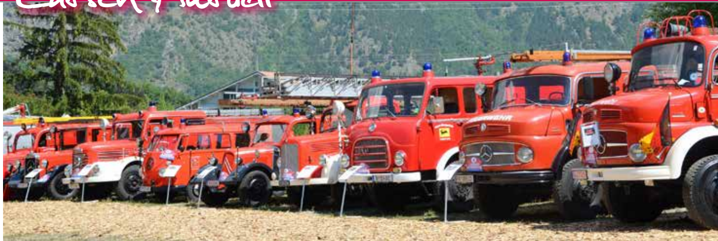
Über 40 Oldtimer waren zu besichtigen