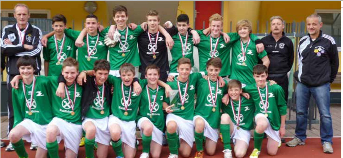
Die U-13 holte sich den ersten Platz und den Pokalsieg