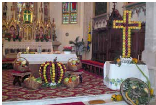
Beim Erntedankfest, das immer am letzten Sonntag im Oktober gefeiert wird, schmückt die SBJ Latsch die Kirche unter anderem mit einer Apfelkrone und verschiedenen Körben gefüllt mit Obst und Gemüse.

Die Latscher Ortsgruppe ist mit ihren vielen Mitgliederstimmen eine der stärksten und größten im Vinschgau. Ein Fixpunkt im Jahresprogramm der SBJ Latsch ist das Erntedankfest, das immer am letzten Sonntag im Oktober gefeiert wird. Anschließend wird auf dem Kirchplatz ein Frühschoppen organisiert. „Wir dekorieren bei diesem wichtigen Ereignis die Kirche mit verschiedenen Körben, die wir mit Obst und Gemüse füllen. Zudem wird neben dem Altar eine Apfelkrone aufgebaut und weitere landwirtschaftliche Erzeugnisse wie etwa Wein, Speck oder Brot aufge-