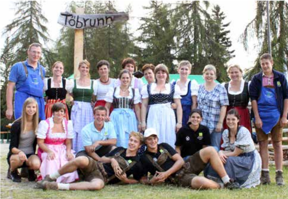
Am 17. August organisiert die Bauerjugend Latsch auf dem Töbrunn zusammen mit den Bäuerinnen ihren „Kirchta“.