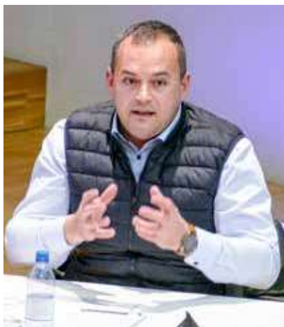
Bürgermeister Mauro Dalla Barba